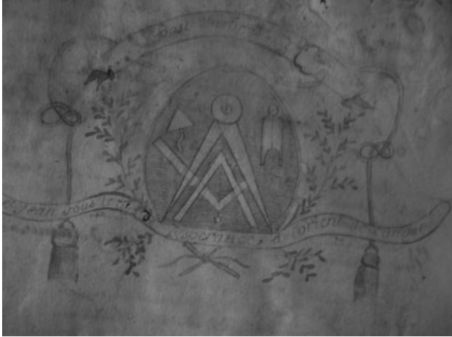
Page de garde du livre d'architecture de l'Espérance

C'est la Respectable Loge Saint Jean à l'Orient d'Auch qui donne les constitutions primitives à cet Atelier le 7 août 1762.