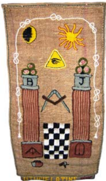
Bannière de la Loge L'Utopie Latine à Pamiers (p.27)