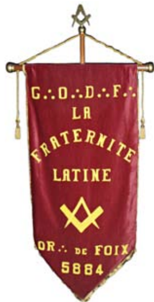
Bannière de la Loge la Fraternité Latine à Foix (p.9)