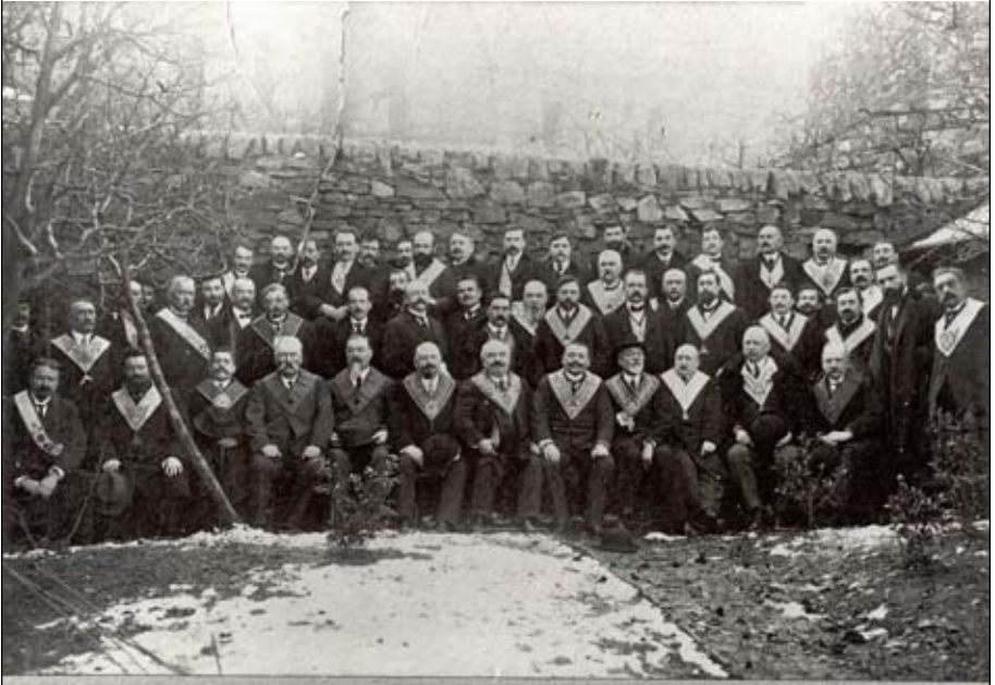
Fête du Cent Cinquantenaire des la Loge 'La Parfaite Union' O. S. de Rodez 19 Juin 1762 — 21 Décembre 1913