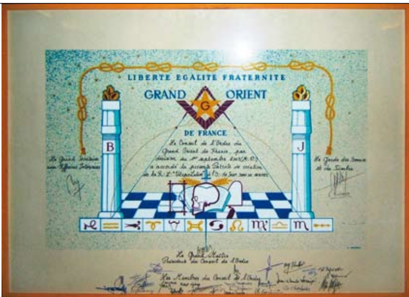
Patente de la Loge L'Utopie Latine à Pamiers (p.27)