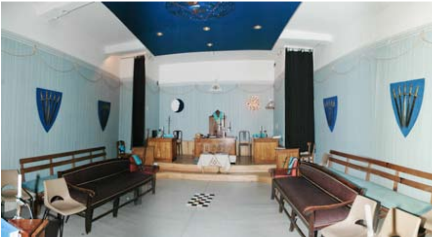
Temple de la Loge La Nouvelle Cordialité à Villefranche-de-Rouergue (p.49)