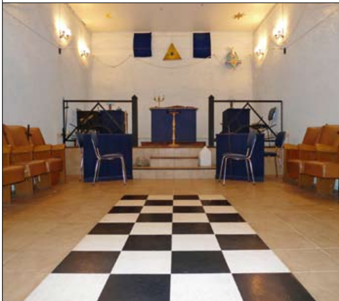
Temple de la Loge Raison et Fraternité à Lavelanet (p.23)