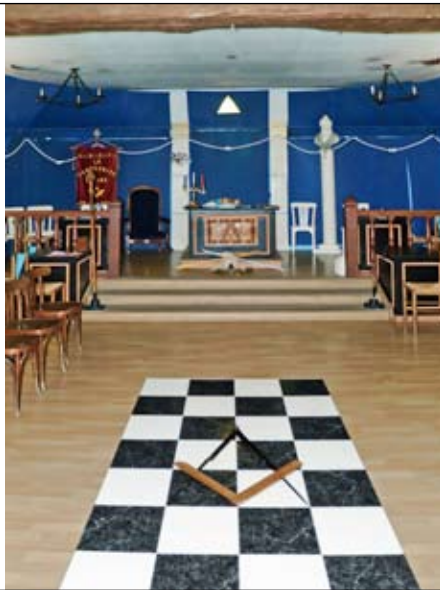
Intérieur du Temple de l'Orient de Foix (p.9 et 27)