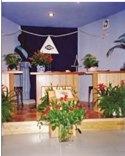
Temple de la Loge L'Éole 89 à Muret (p.91)