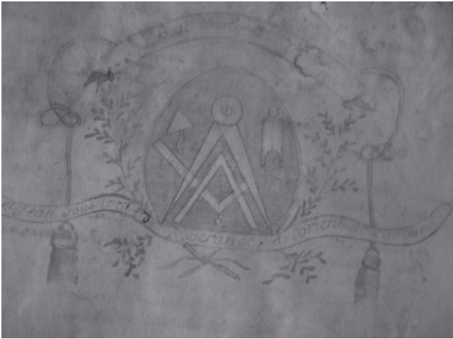
Page de garde du livre d'architecture de l'Espérance

C'est la Respectable Loge Saint Jean à l'Orient d'Auch qui donne les constitutions primitives à cet Atelier le 7 août 1762.