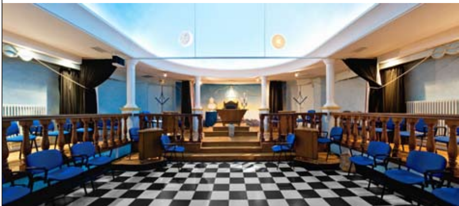
Temple de l'Orient de Toulouse