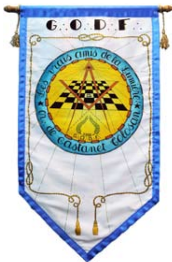
Bannière de la Loge Les Vrais Amis de la Lumière à Castanet (p.83)