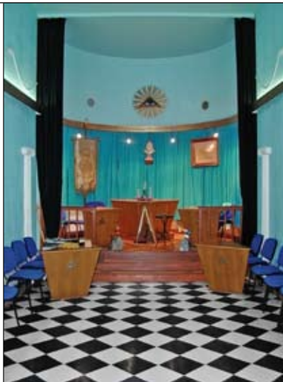
Temple de la Loge Les Indépendants à Montréjeau / Saint-Gaudens (p.97)