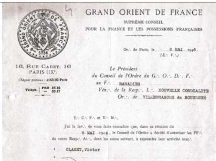
Après la Libération, exemple de réintégration d'un Frère de la Loge La Nouvelle Cordialité (p.49)