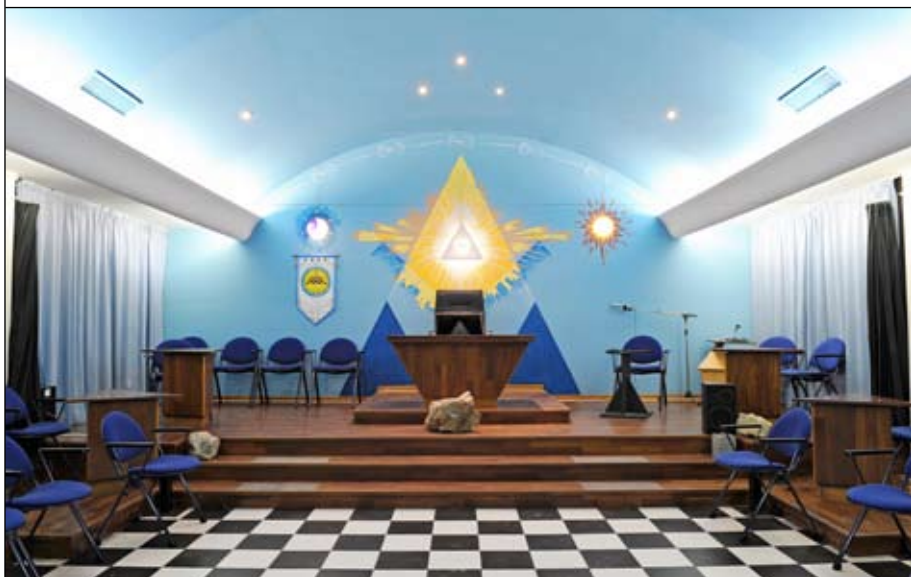
Temple de l'Orient de Castanet (p.73 et 83)